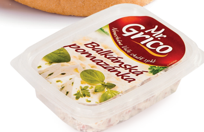
lahůdky, bagety, dezerty zeleninové saláty, rybí výrobky

Mr. Grico CZ s.r.o. provozovna Na Červenici 2002 568 02 Svitavy tel.: 461 533 126, tel.: 604 208 367 e-mail: objednavky@grico.cz info@grico.cz