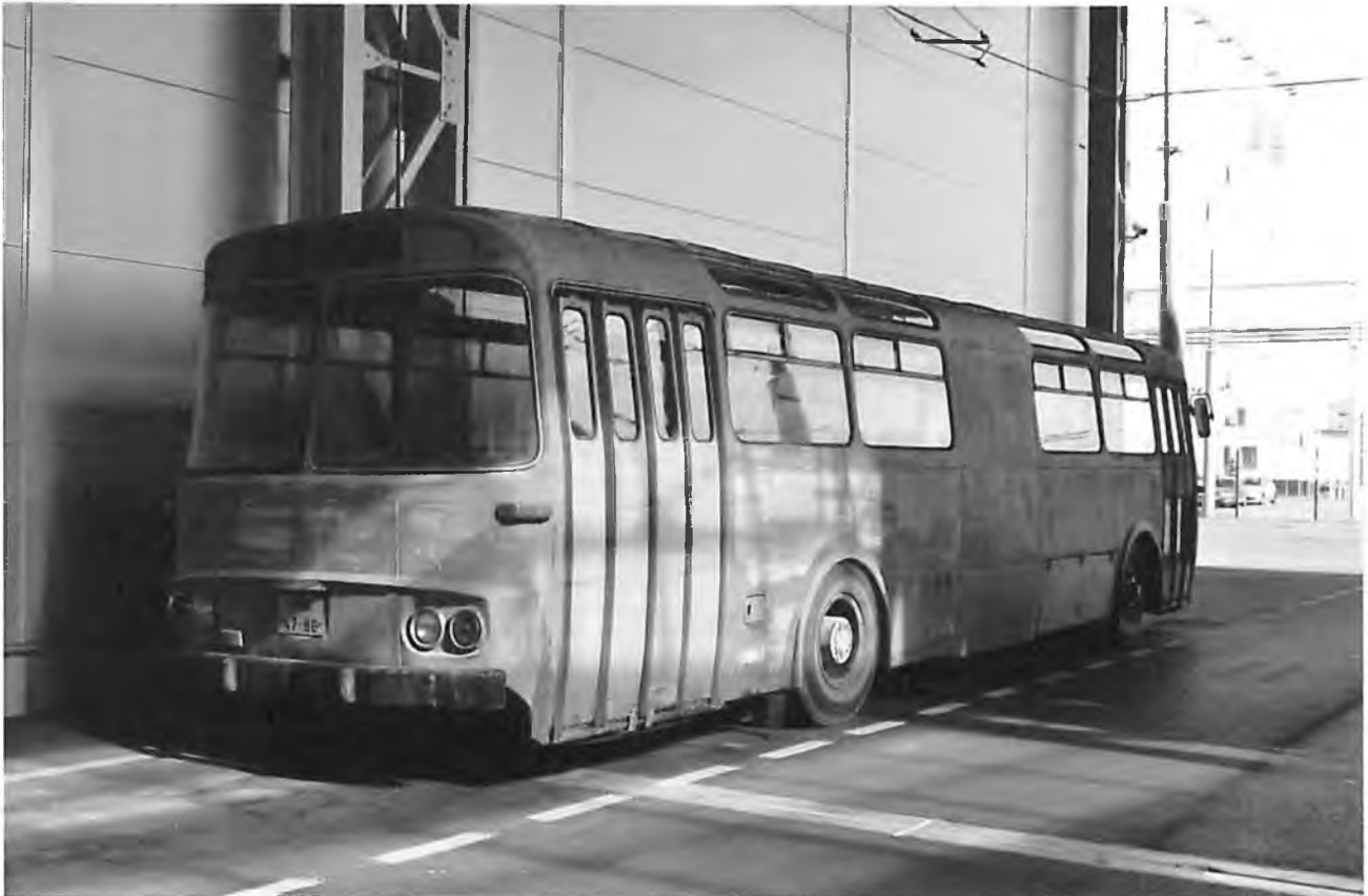
Současný stav autobusu k renovaci.