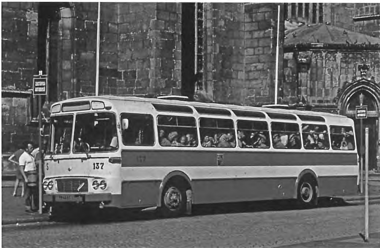
Autobus ze stejné série jako je autobus určený k renovaci, po zařazení do provozu. Autor Jiří Maurenz. nešířit dále.