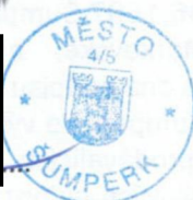
Město Šumperk Mgr. Zdeněk Brož starosta