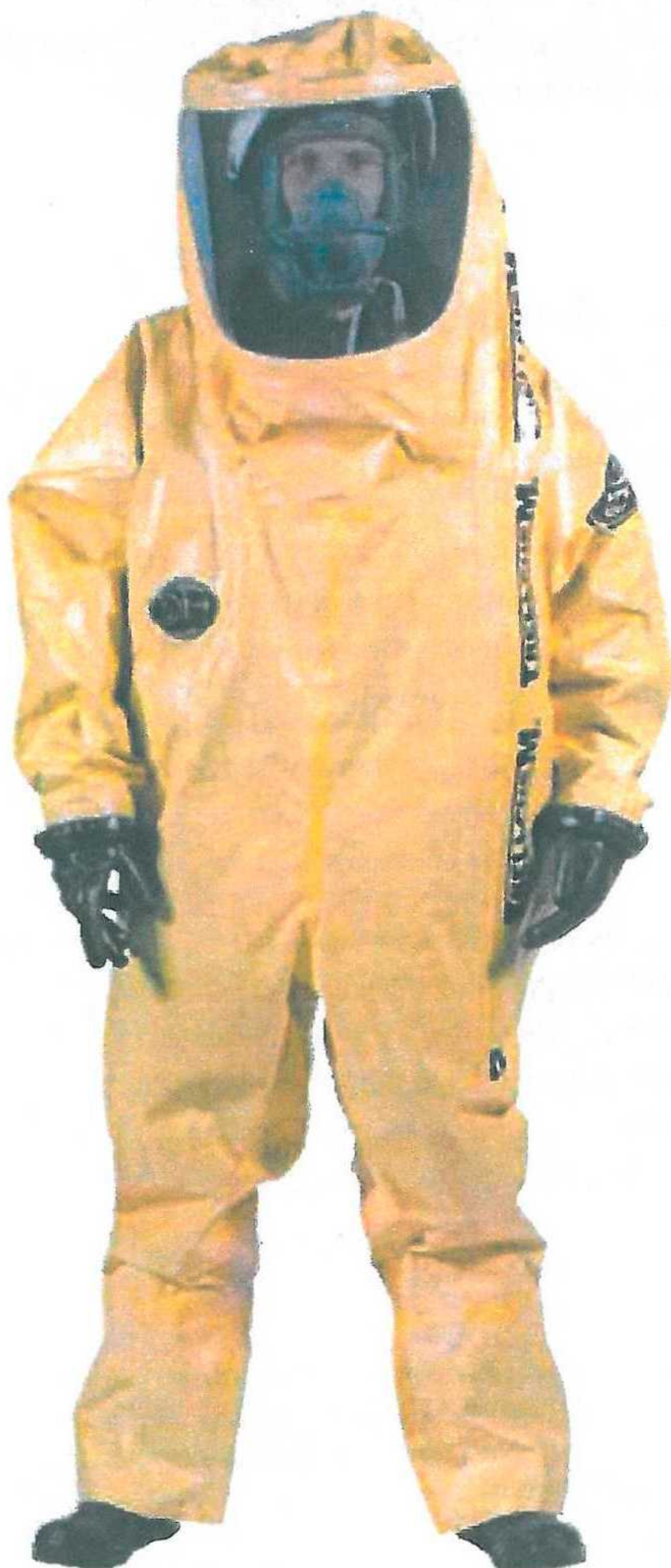
Trellchem VPS typ CV s všitými ponožkami / botami nebo samostatné boty.

Nezapouzdřené oděvy jsou vybaveny anatomicky tvarovanou obličejovou manžetou.