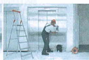
Servis 24 hodin