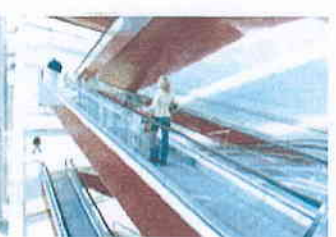
Eskalátory & pohyblivé chodníky