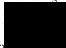
Zdeněk Jelínek ředitel Života 90 Zruč n.S., z.ú.

Život 90 Zruč nad Sázavou, z. ú. sad Míru 789 ① 285 22 Zruč nad Sázavou tel.: 327 534 158, IČ: 04616685