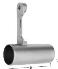
LEVER ARM HEBELARM