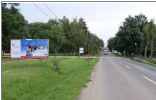
Reklamní plocha č. 71480