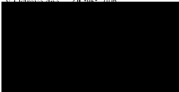
za pronajímatele Bc. Martin Bednář starosta městského obvodu Ostrava-Jih