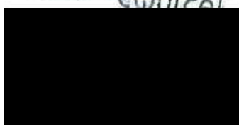
Poskytovatel Bc. Vladimír Matějček