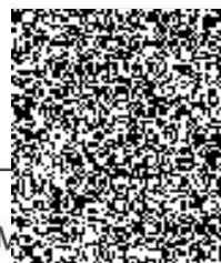
vedoucí prodeje ČR