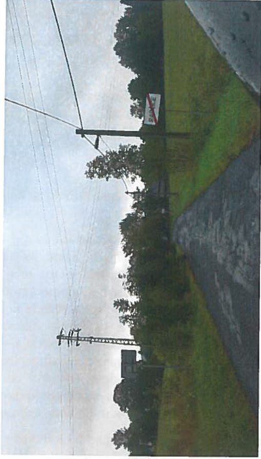
Silnice III/2882 a III/2884 Jílové u Držkova a Radčice, rekonstrukce silnice