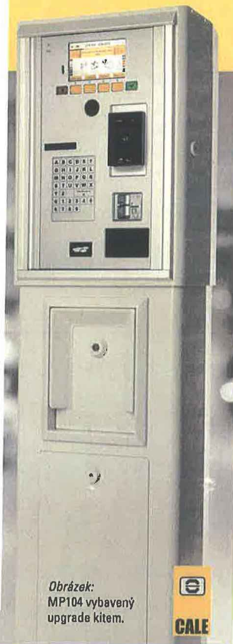
Obrázek: MP104 vybavený upgrade kitem.

**1) Doba provozu v autonomním režimu závisí na velikosti baterie, okolních podmínkách, a objemu vydaných listků. V případě solárního režimu je nutno vzít v úvahu i geografické umístění přístroje.