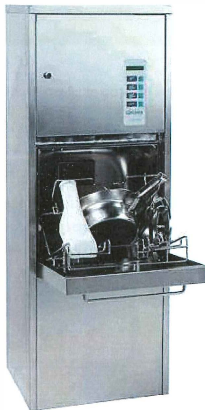
Mycí a dezinfekční automat pro mytí podložních mís a močových lahví Belimed - Lischka typ CDD 1050