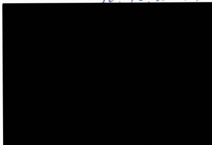
jednatel společnosti Parníky Praha EU, s.r.o.