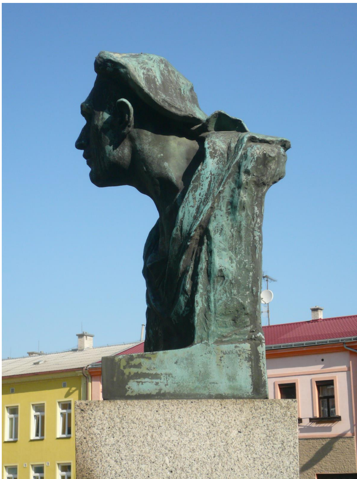
Celkový pohled na bronzovou bustu