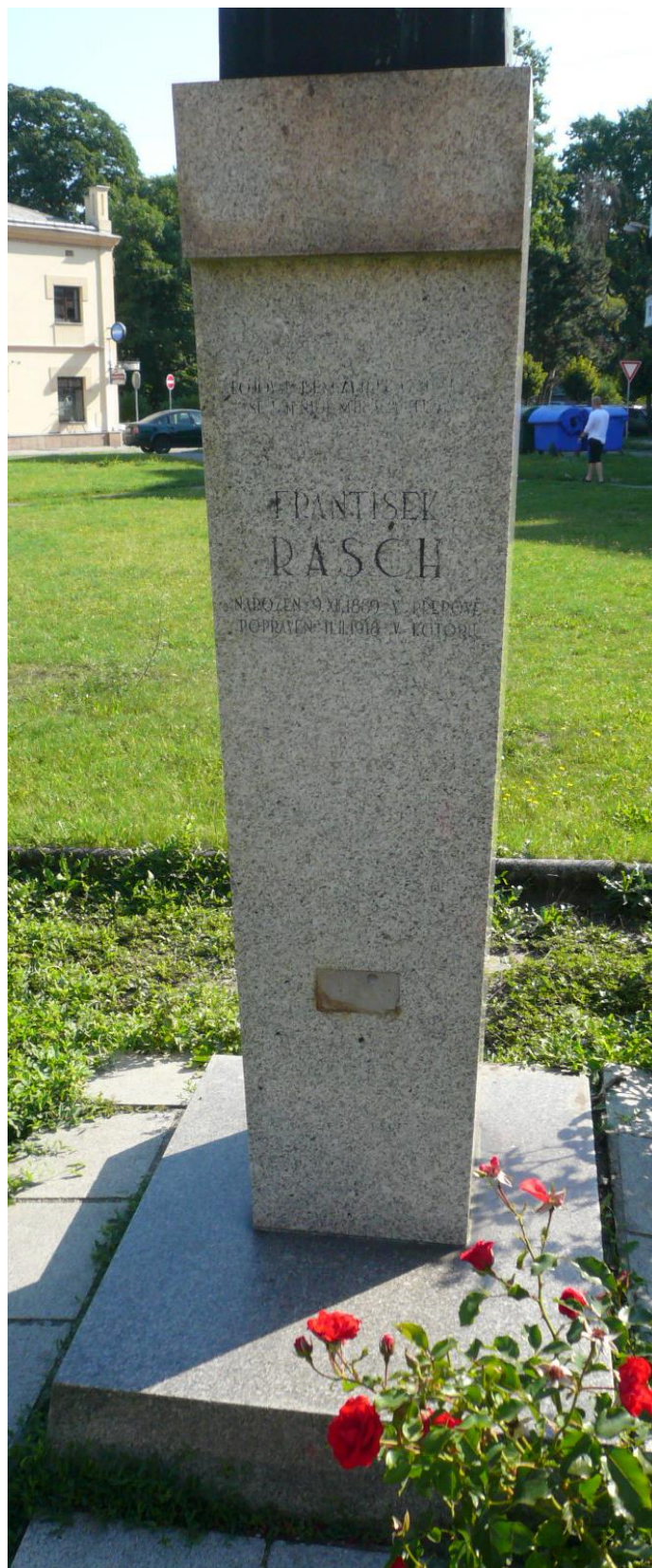
Celkový pohled na žulový podstavec