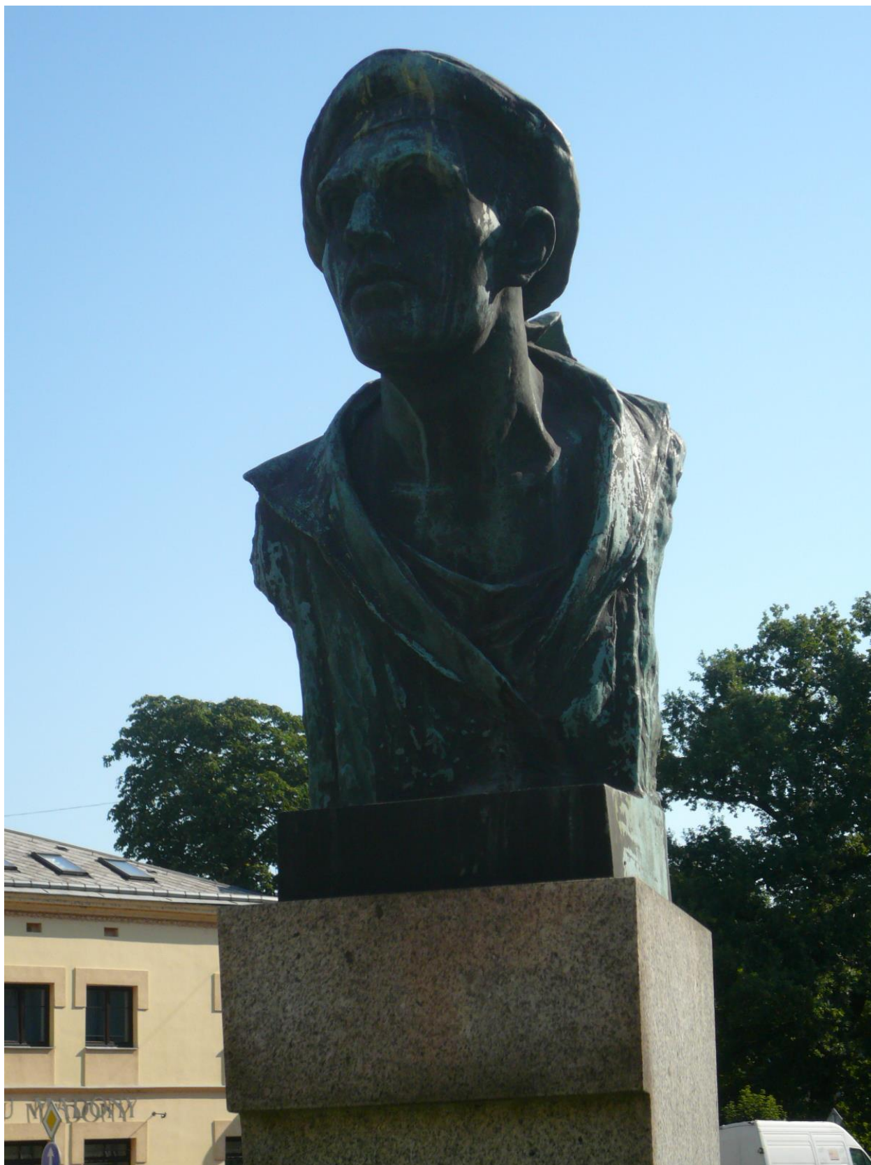
Celkový pohled na bronzovou bustu