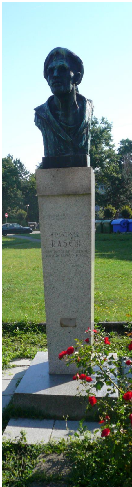
Celkový frontální pohled na pomník