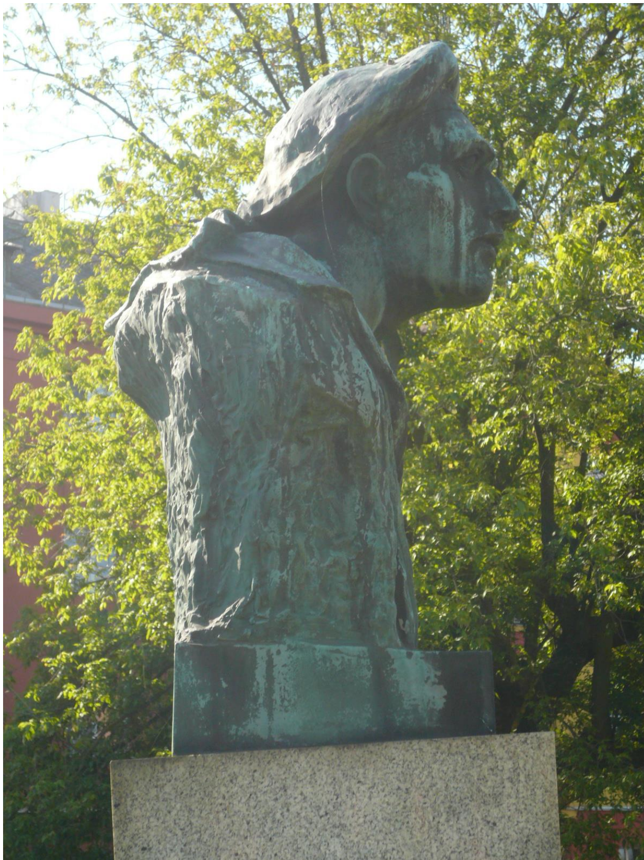
Celkový pohled na bronzovou bustu