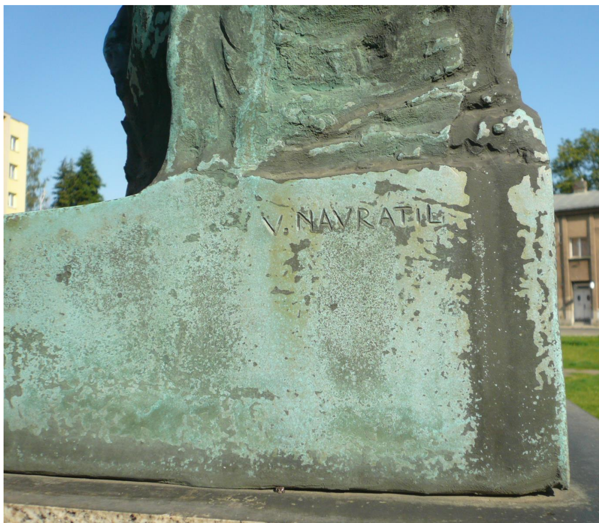
Celkový pohled na bronzovou bustu