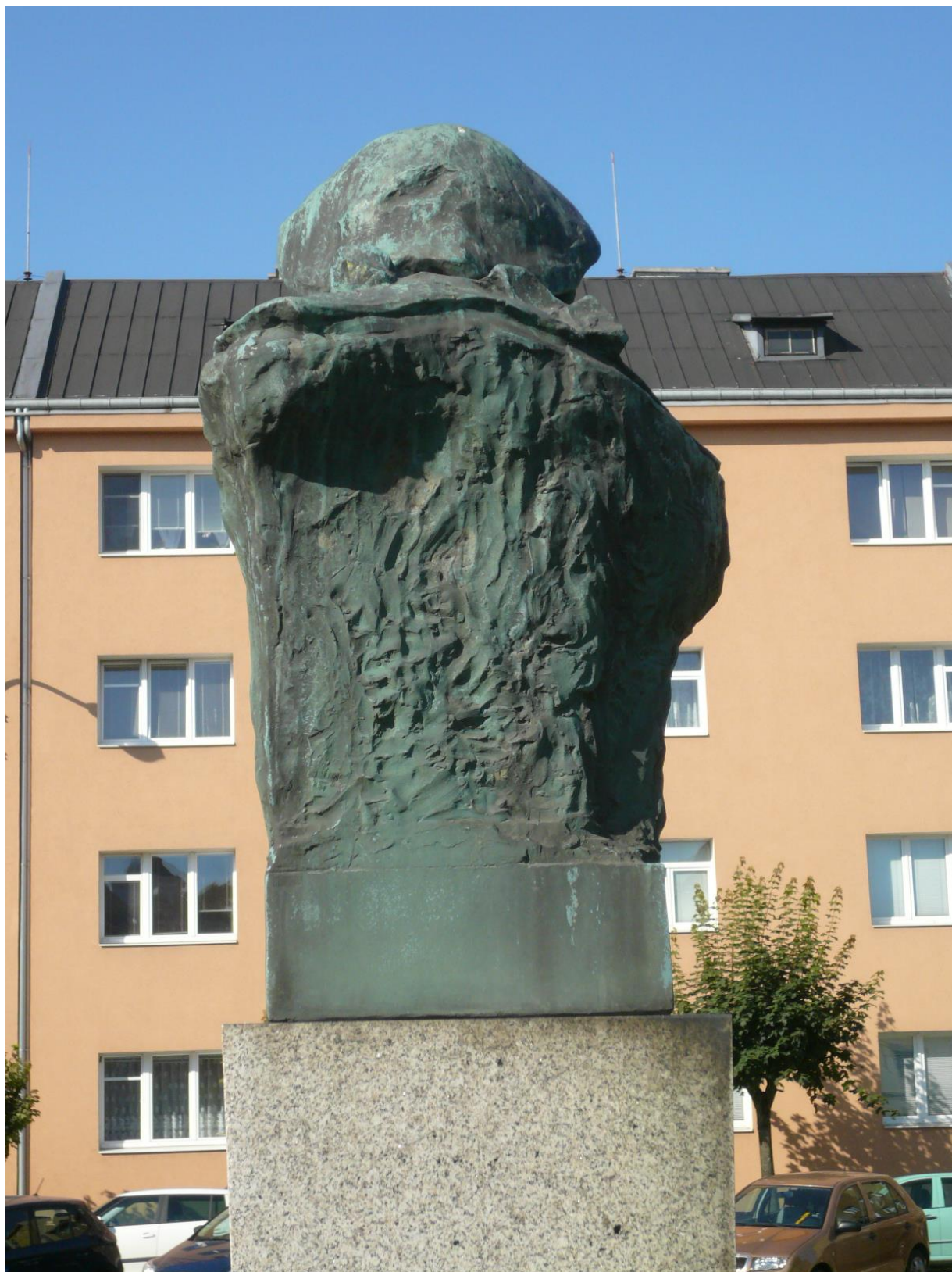
Celkový pohled na bronzovou bustu