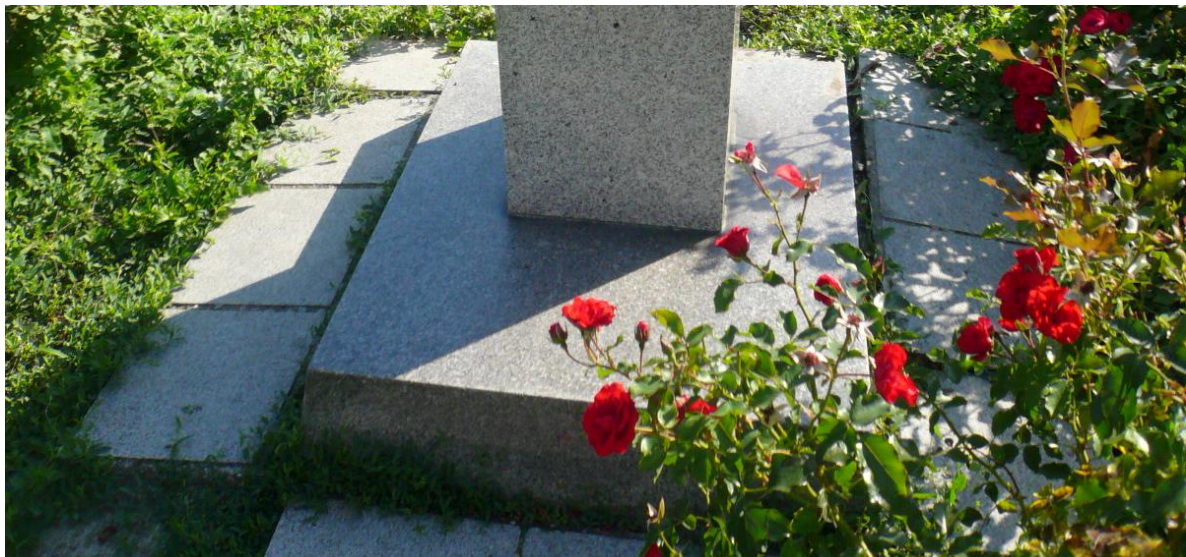
Pohled na patku soklu