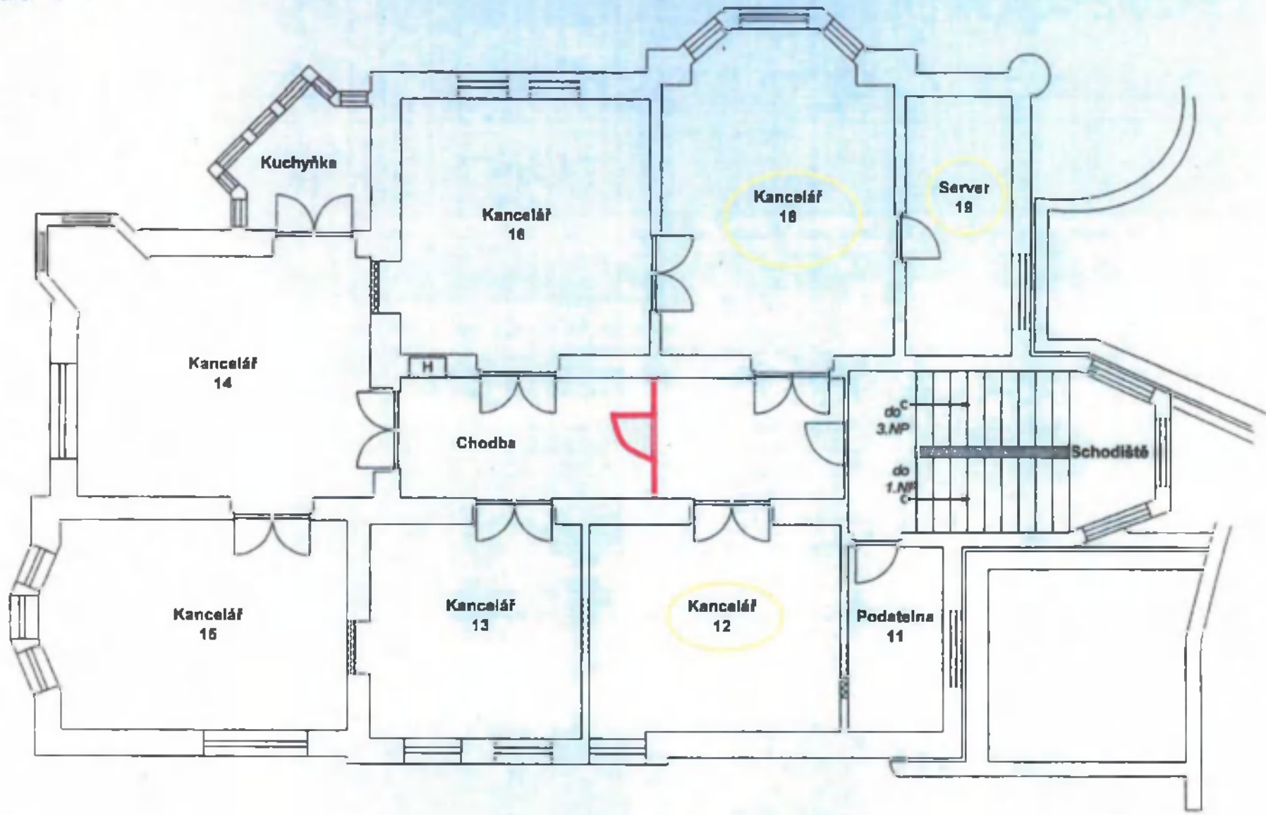
Miličova 20 Stará budova 2.NP a nebytové prostory na půdě budovy (3.NP)