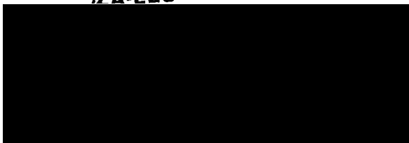
Za zhotovitele Petr Fuxa