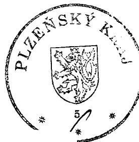
Mgr. Zdeněk Honz náměstek hejtmana pro oblast sociálních věcí