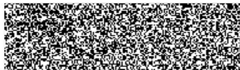
brig. gen. Ing. František Menci ředitel HZS KH kraje

Česká republika Hasičský záchranný sbor Královéhradeckého kraje nábreží u Přivozu 122/4 500 03 Hradec Králové IČ: 70882525 CZ-NUTS: CZ0521 48