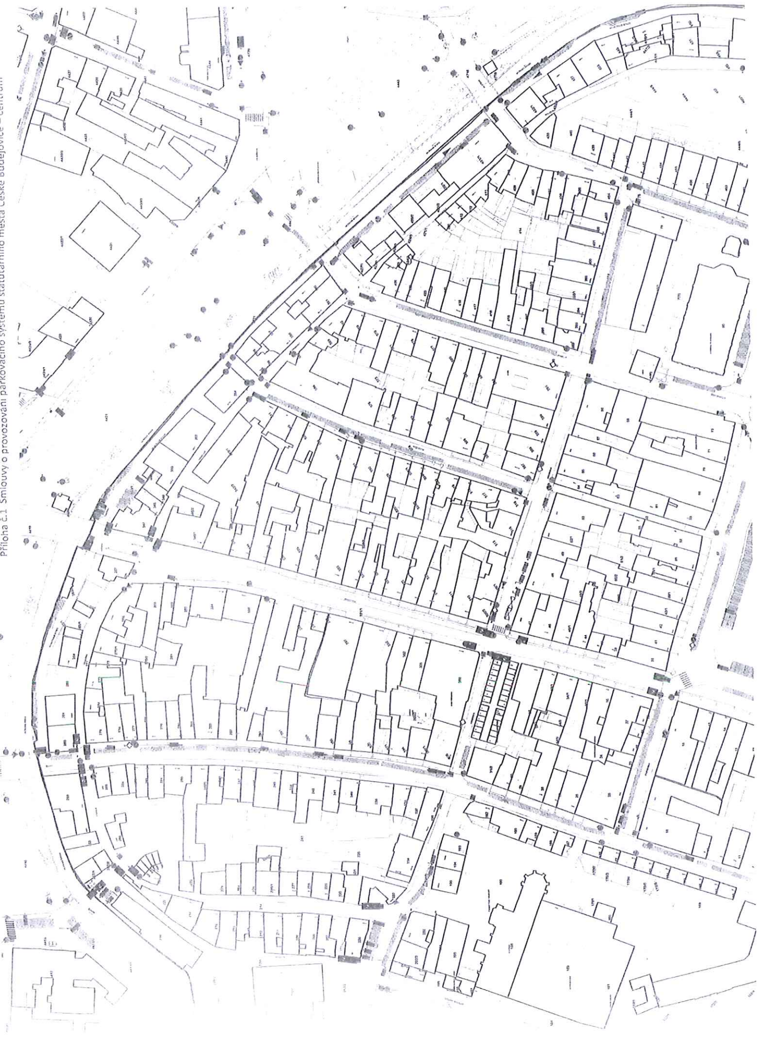
Příloha č.1 Smlouvy o provozování parkovacího systému statutárního města České Budějovice – centrum