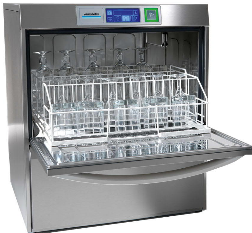
Podstolová myčka nádobí Winterhalter UC-M COOL

Hraspospol.s.r.o. Tuřanka 107, 627 00 Brno tel.: + [REDACTED] www.hraspo.cz