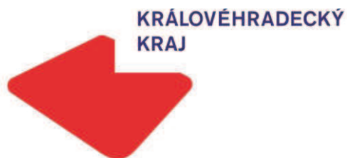
Obr. č. 8 Vzor logotypu Královéhradeckého kraje