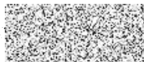
bankovní poradce Veřejný sektor – velcí klienti