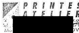
PRINTES-ATELIER s.r.o. Ing. Tomáš Grapl jednatel