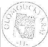
Olomoucký kraj Mgr. Jiří Zemánek 1. náměstek hejtmána