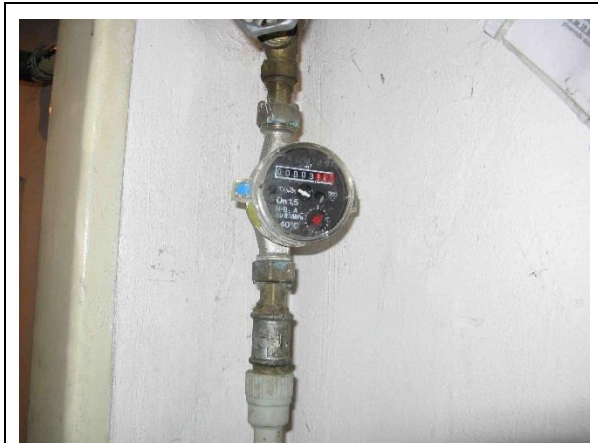
Vodoměr ve vybavení plynové kotelny