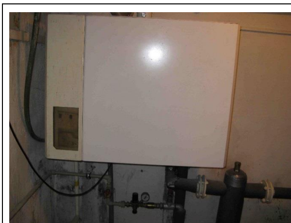
Nástěnný kondenzační plynový kotel Buderus Logamax Plus GB 162-43