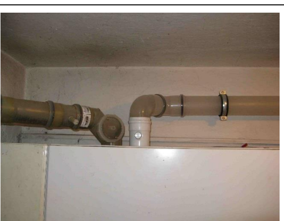
Plastové odsávací a přisávací potrubí vzduchu do plynového kotle