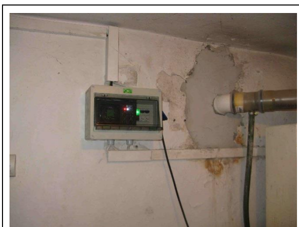
Regulátor vytápění KOMEX THERM PA 5