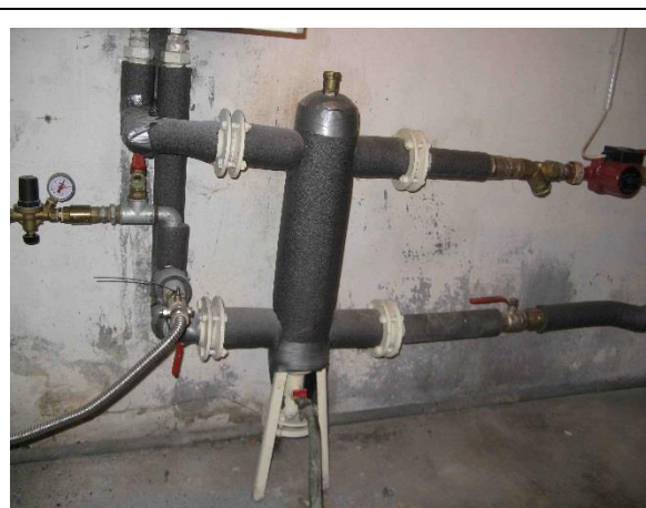
Hydraulický vyrovnávač dynamických tlaků HVDT II a část potrubních systémů plynové kotelny