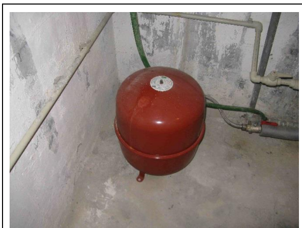
Expandér REFLEX N 35