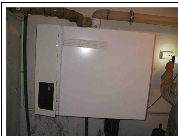
Nástěnný kondenzační plynový kotel Buderus Logamax Plus GB 162-43