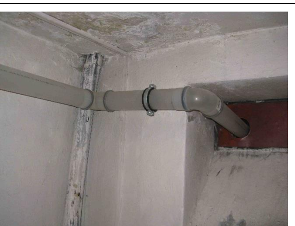
Plastové přísávací potrubí vzduchu do plynového kotle