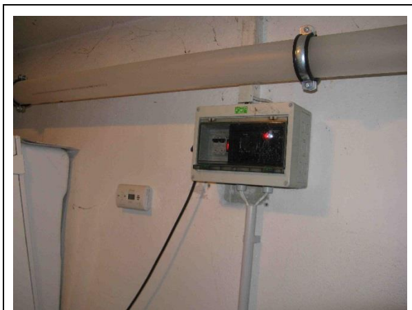
Regulátor vytápění KOMEX THERM PA 5 a detektor CO KIDDE 8LLDCO