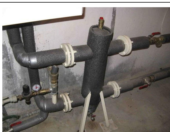
Hydraulický vyrovnávač dynamických tlaků HVDT II