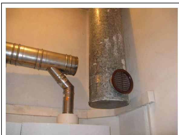
Odtah spalin do komína a přísávací potrubí