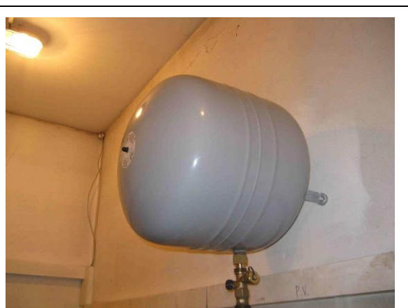
Expandér REFLEX NG 50