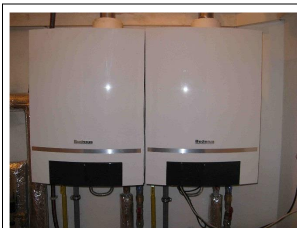
Nástěnné kondenzační plynové kotle Logamax Plus GB 162-35