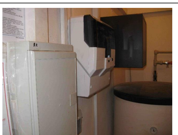
Rozvaděč a skříň MaR