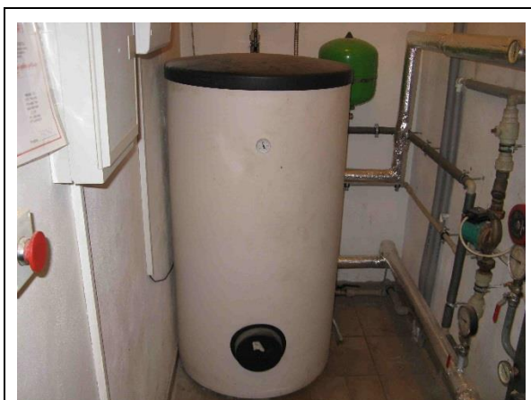
Ohřívač vody E 300