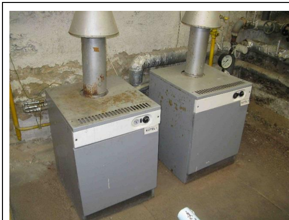
Stacionární plynové kotle HÖTERM 70 ESB