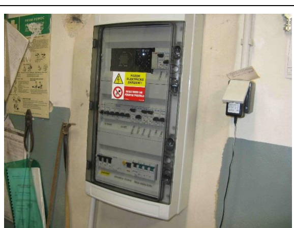
Rozvaděč a ovládání KOMEX THERM