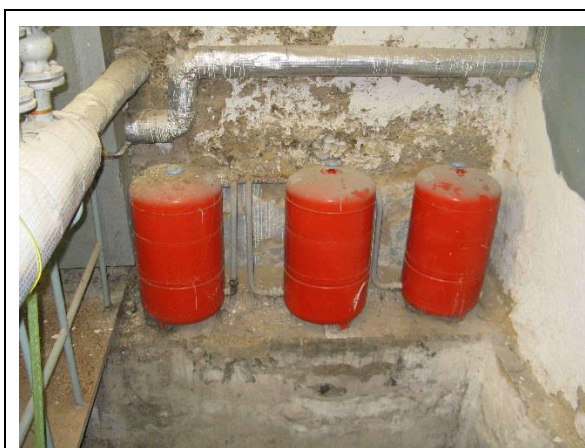
Expandéry EXPANZOMAT 1 v kotelně