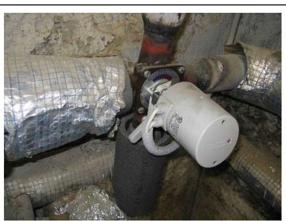
Regulační čtyřcestný ventil s pohonem