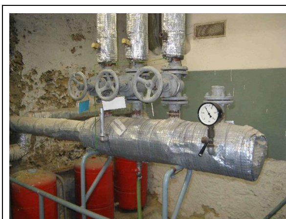
Pohled na rozdělovač topné vody a potrubní systémy