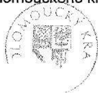
Mgr. Radovan Rašák náměstek hejtmána Olomouckého kraje