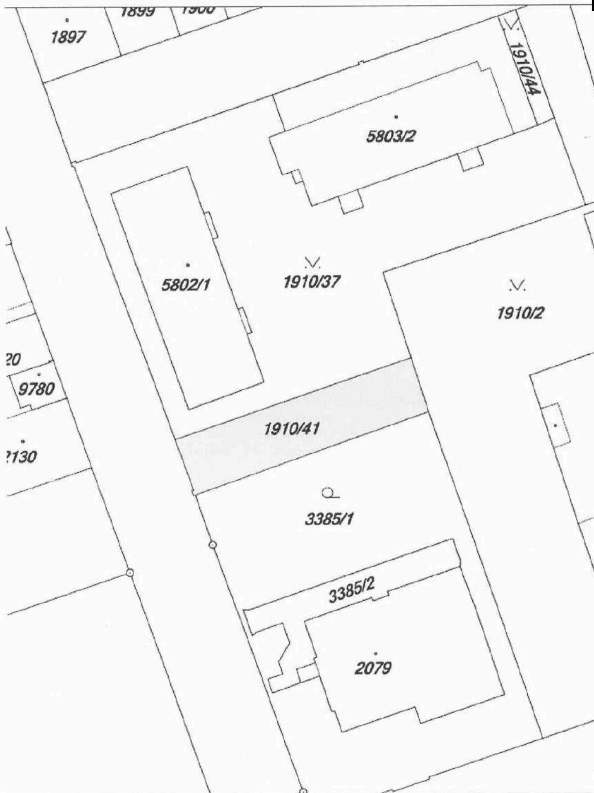
Příloha č. 1 – zákres v katastrální mapě