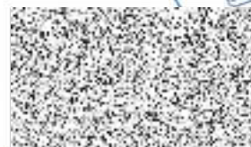
Oprávněný zástupce Středočeského kraje