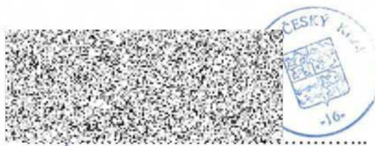
Oprávněný zástupce Středočeského kraje

Diakonie ČCE - středisko Praha Vlachova 1502/20 155 00 Praha 13 Stodůlky IČO: 629 31 270 -1-