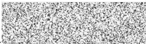
Mgr. Jakub Suchel ředitel

Diakonie ČCE - středisko Praha Vlachova 1502/20 155 00 Praha 13 Stodůlky IČO: 629 31 270 -1-