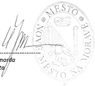
Michal Šmarda starosta

v Novém Městě na Moravě dne 3. října 2016