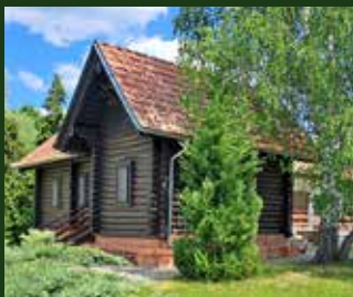
Chata Jagdhütte Dubravka