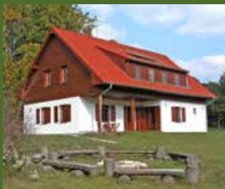
Chata Jagdhütte Bulhary