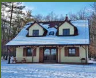
Chata Diana Jagdhütte Diana Moravský Krumlov