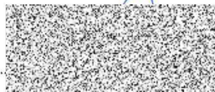
Nájemce Jindřich Chytráček