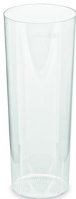
Kelímek vratný na LONGDRINK 4 cl / 0,3 l (PP) [10 ks] (/eshop/info/kelimek-vratny-na-