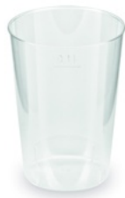
Kelímek vratný 0,1 l (PP) [40 ks] (/eshop/info/kelimek-vratny-01-l-pp-40-ks)