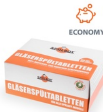
Tablety na mytí sklenic Classic 48 x 4 ks [750 g] (/eshop/info/tablety-na-myti-sklenic-