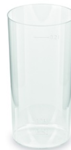
Kelímek vratný na LONGDRINK 2 cl / 0,2 l l [10 ks] (/eshop/info/kelimek-vratny-na-