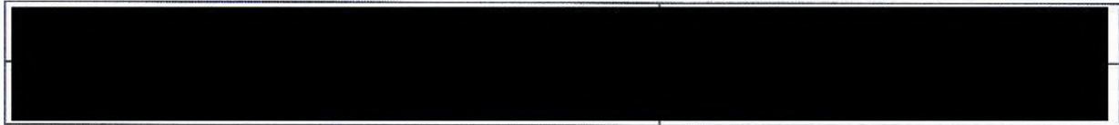
Tabulka současných lokalit