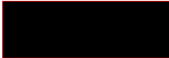
Pavel Bochnia, starosta Statutární město Ostrava, Úřad městského obvodu Polanka nad Odrou