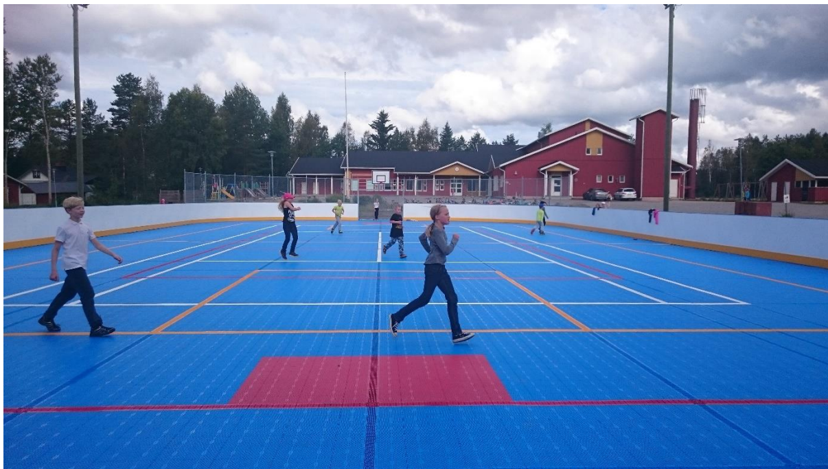
Realizace Finsko- multifunkční hřiště