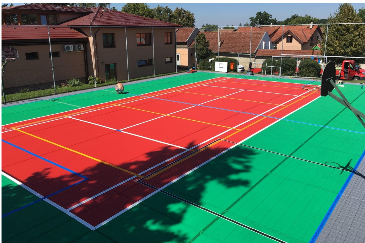
Realizace Hájek, Praha 22- multifunkční hřiště