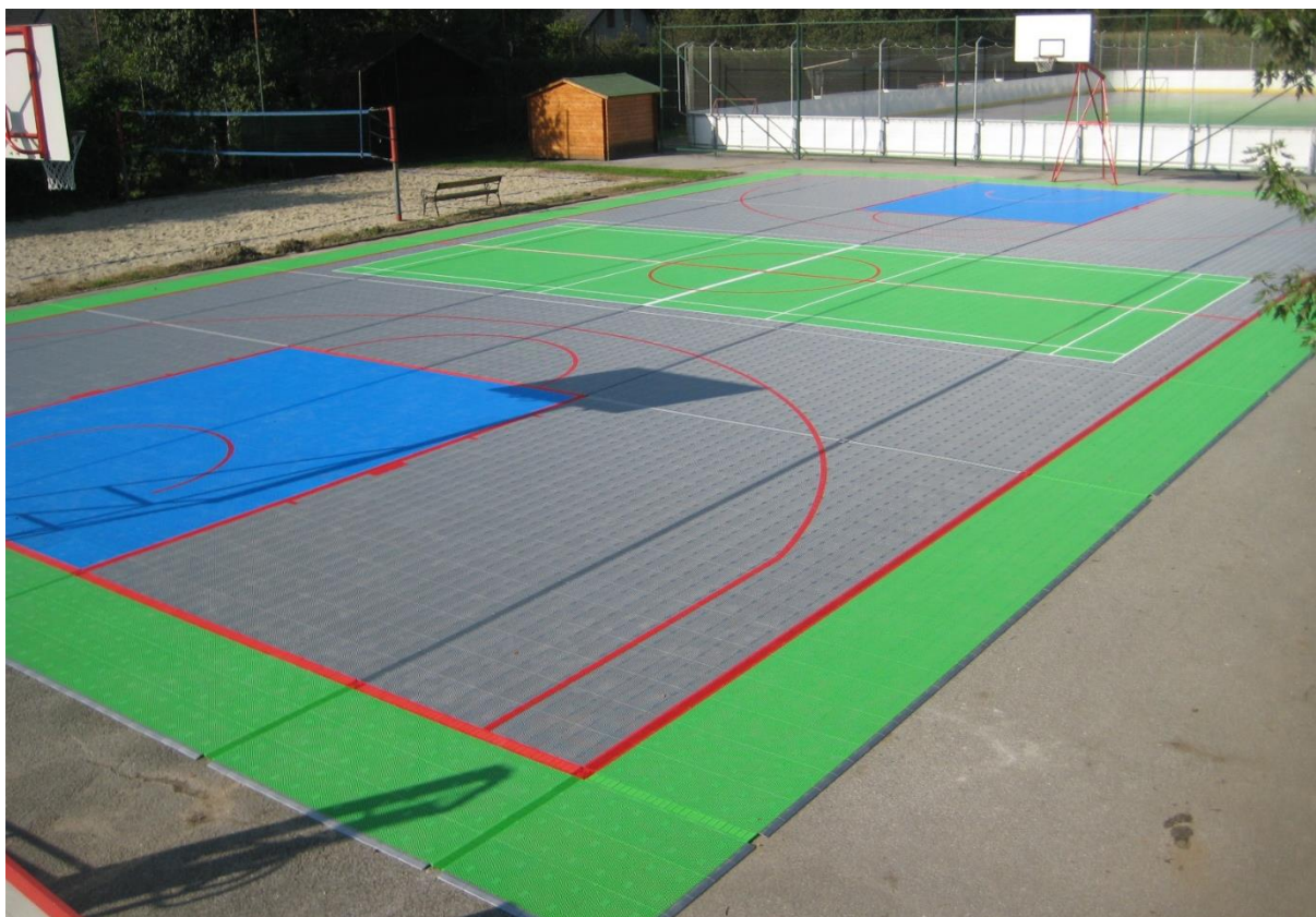
1Realizace Slovinsko- školní hřiště