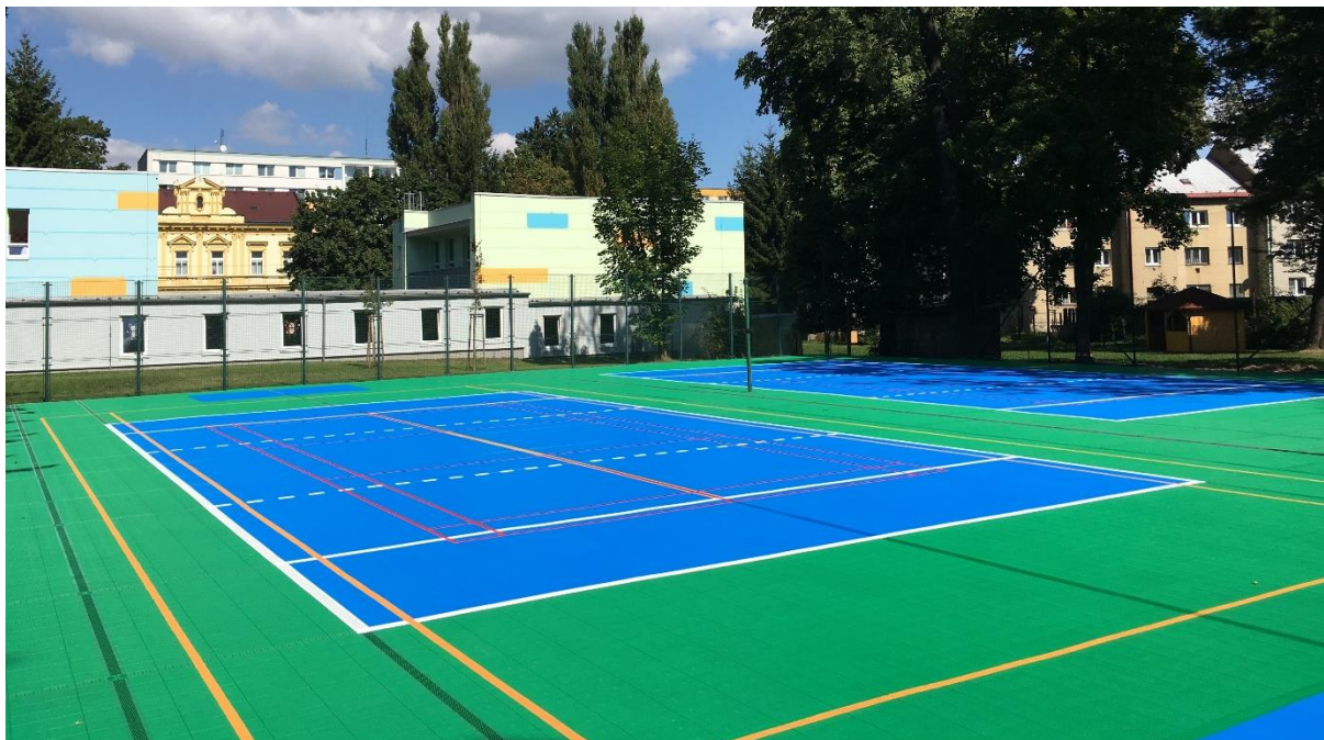
Realizace Svitavy- školní hřiště