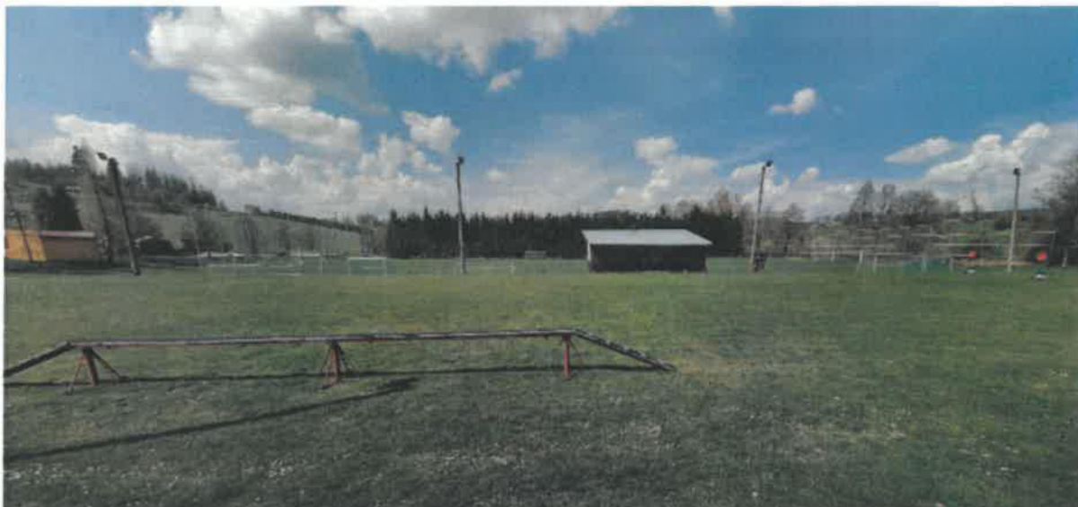
Workoutové hřiště Řehořov