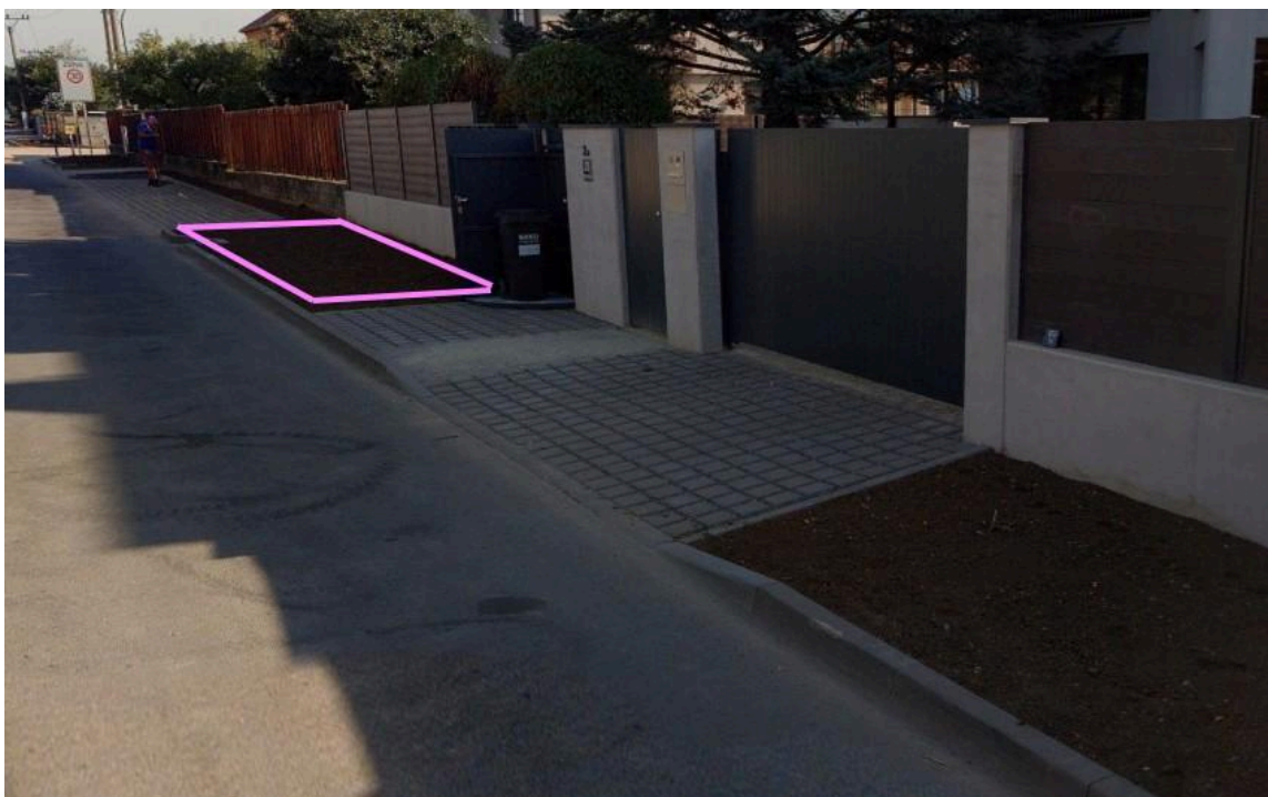
Záhon na ulici Hatě u parku na Hatích – 3. záhon