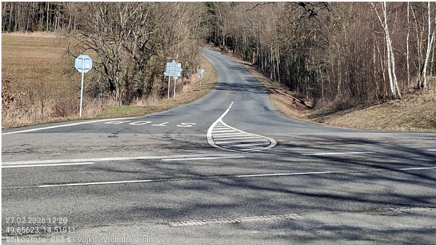
27.02.2026 12:20 49.65623, 14.51911 Vojkov rožč. 257 53 Vojkov-Vrchotovy Janovice