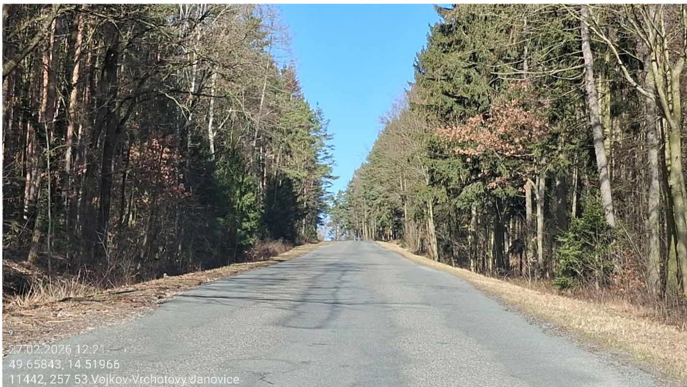
27.02.2026 12:21 49.65843, 14.51966 11442, 257 53 Vojkov-Vrchotovy Janovice