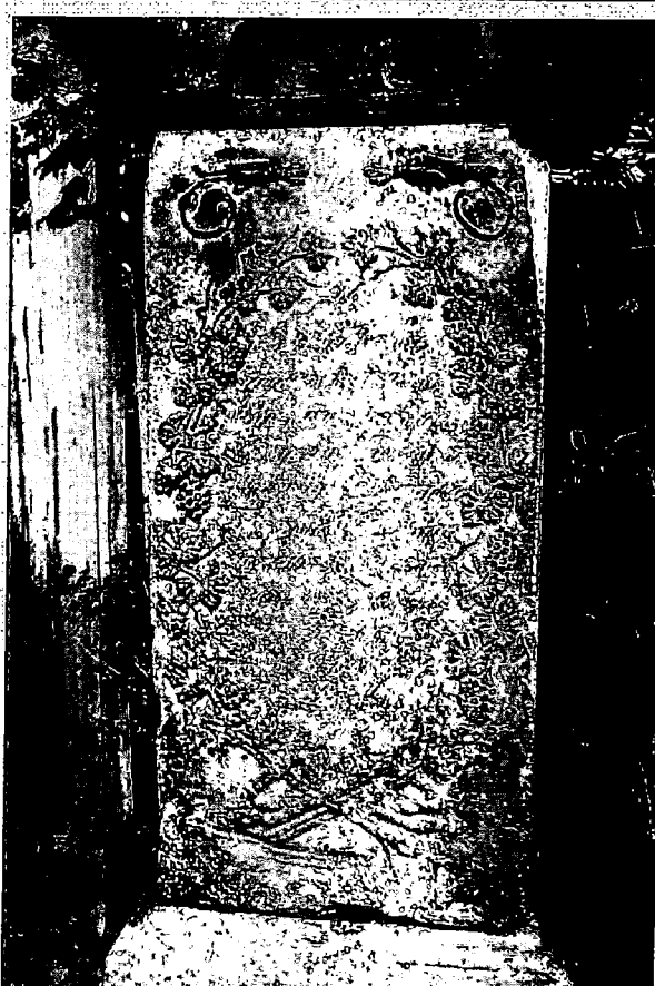
Pohled na poškozený kříž v ulici Nová v Rumburku, před č. popisným 12, stav z července 2017 (umělecko historický předmět není zapsaný v ÚSKP)