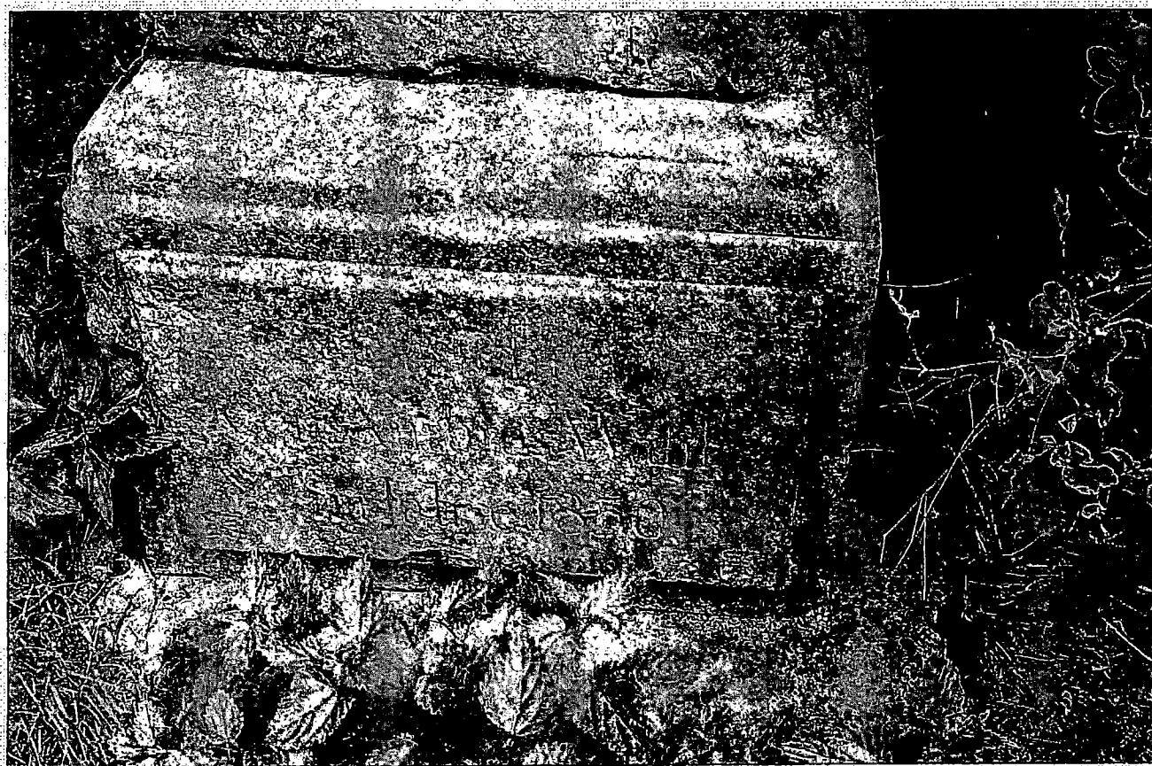
Pohled na poškozený kříž v ulici Nová v Rumburku, před č. popisným 12, stav z července 2017 (umělecko historický předmět není zapsaný v ÚSKP)