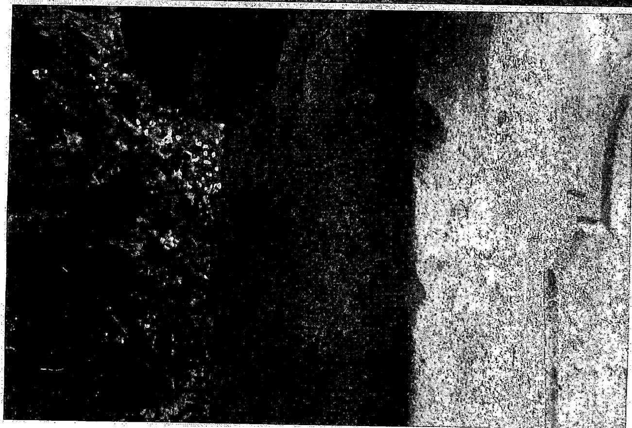
Pohled na poškozený kříž v ulici Nová v Rumburku, před č. popisným 12, stav z července 2017 (umělecko historický předmět není zapsaný v ÚSKP)