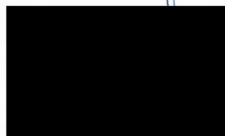
Za zhotovitele Vasyl Krivushchev