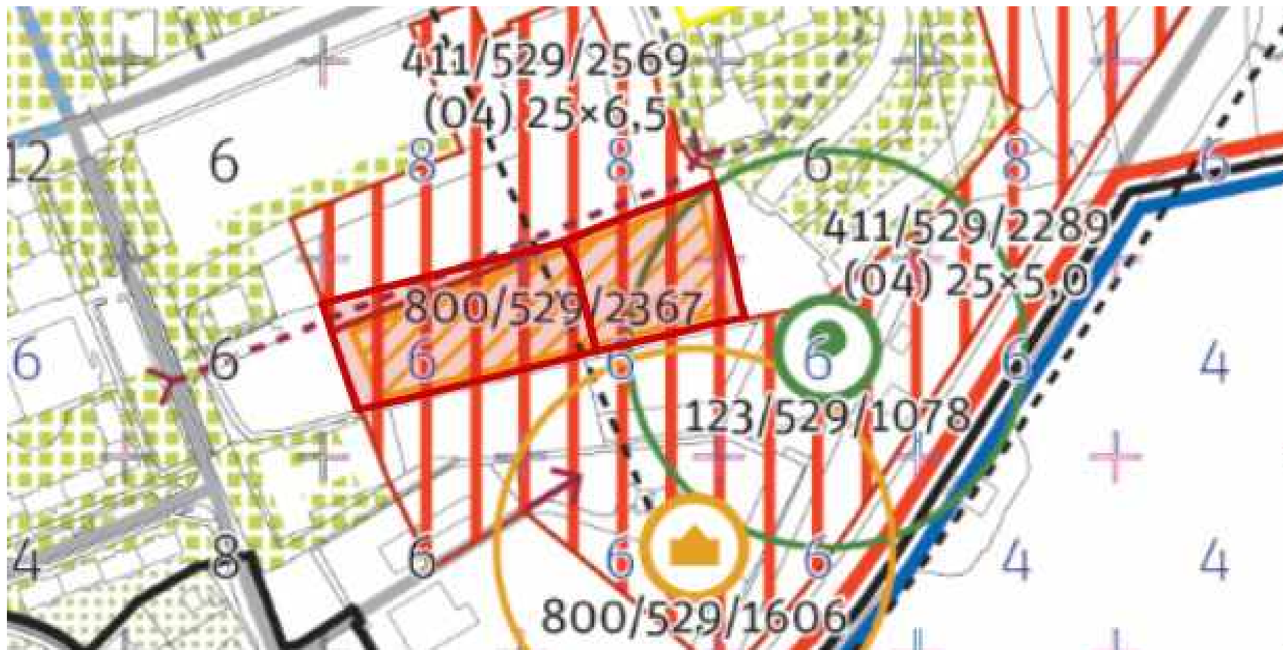
Výřez Metropolitního plánu (pro opakované veřejné projednání 2025) dané oblasti