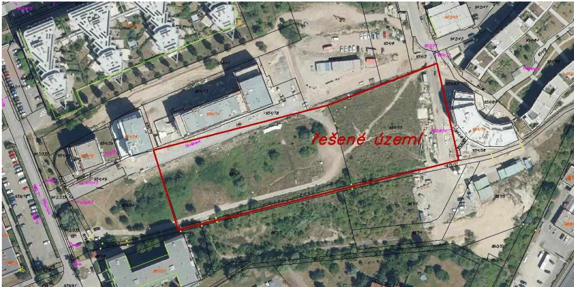
Zákres řešeného území do ortofotomapy 1