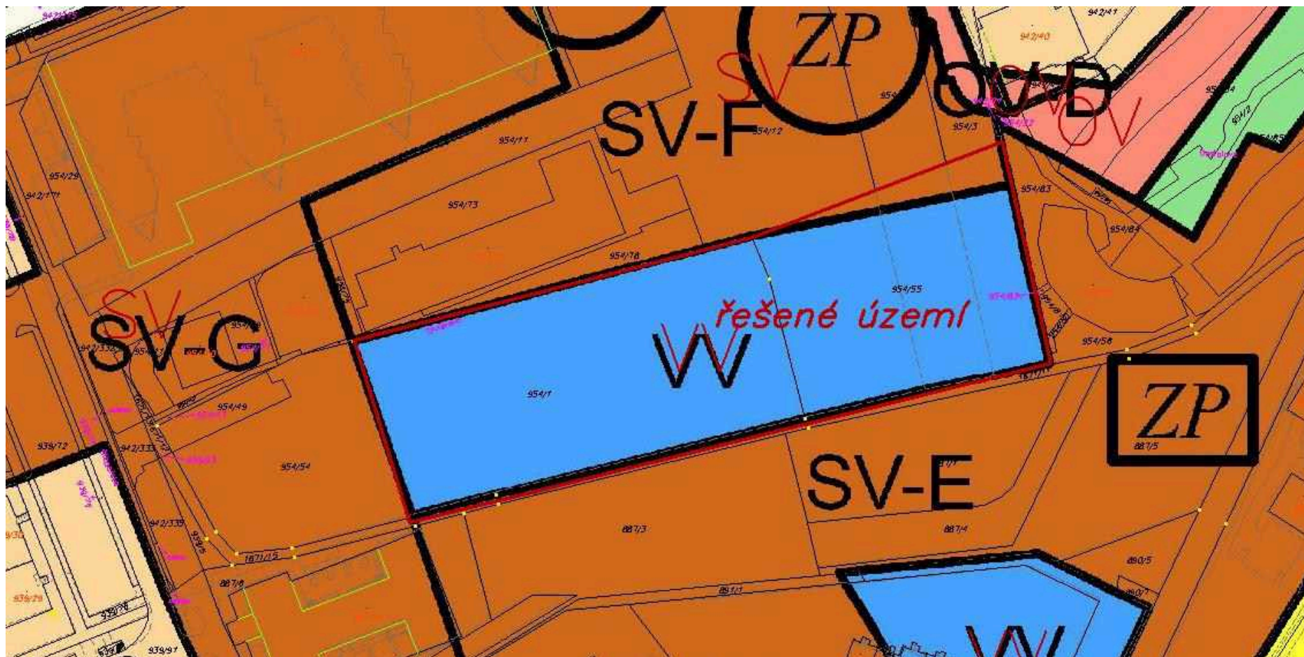
Zákes řešeného území do Územního plánu sídelního útvaru hl. m. Prahy