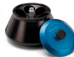
JA-10 FIXED-ANGLE ROTOR