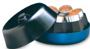
JLA-8.1000 J-LITE FIXED-ANGLE ROTOR