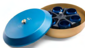
JS-4.2 SWINGING-BUCKET ROTOR