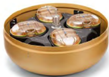
JS-5.0 SWINGING-BUCKET ROTOR