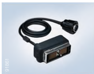
Ultrazvukový kabel MAJ-2056 1,500 mm