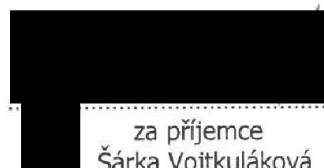
za příjemce Šárka Vojtkuláková členka vedení