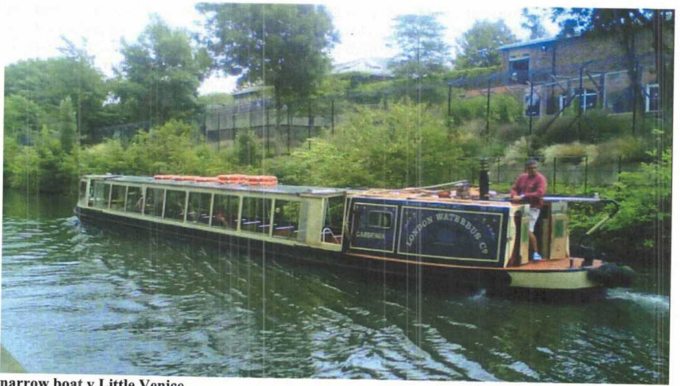
narrow boat v Little Venice